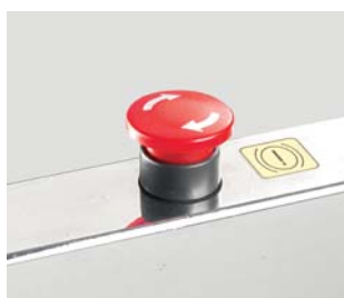
Pulsante di emergenza