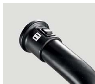
Azionamento a doppi comandi sul manubrio estraibile