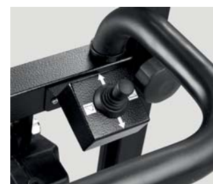
Joystick di comando su manubrio fisso