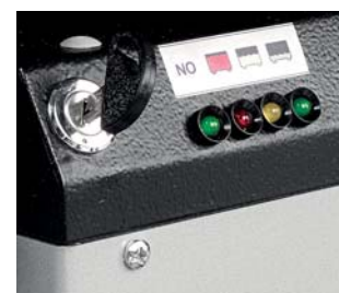
Chiave di accensione e display stato di carica della batteria