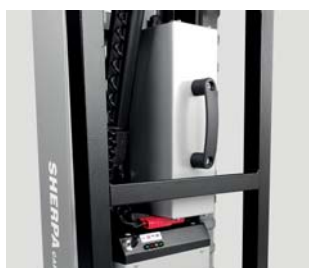
Batteria estraibile e ricaricabile